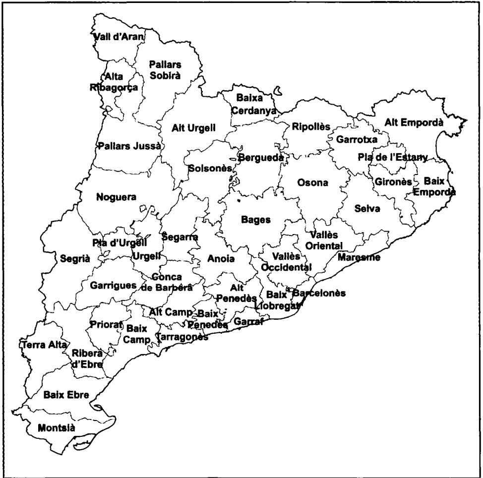
Figura 2. Mapa de Catalunya amb la divisió comarcal.